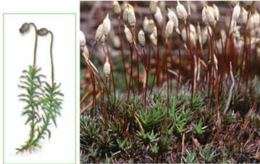
Рисунок 5. -Кукушкин лен обыкновенный ( Polytrichum commune )

многоклеточное образование колбовидной формы. Суженная часть - шейка, а расширенная часть - брюшко, в котором формируется крупная яйцеклетка. На мужском растении (гаметофите) среди верхних красных листьев развиваются антеридии - мужские половые органы, в которых образуются двужгутиковые сперматозоиды. Антеридии имеют вид продолговатых или округлых мешочков на ножке. При созревании архегония шейковые, или канальцевые, клетки ослизняются, и на их месте формируется узкий канал, по которому сперматозоид может проникнуть в яйцеклетку. В период обильных дождей или снеготаяния сперматозоиды подплывают к архегониям. Как предполагают, они обладают хемотаксисом к содержимому слизи архегония. Один из сперматозоидов проникает в архегоний и продолжает движение к яйцеклетке. Слияние гамет и дальнейшее развитие зиготы происходит внутри архегония. Через несколько месяцев из зиготы вырастает спорофит (спорогон) в виде коробочки на длинной ножке.