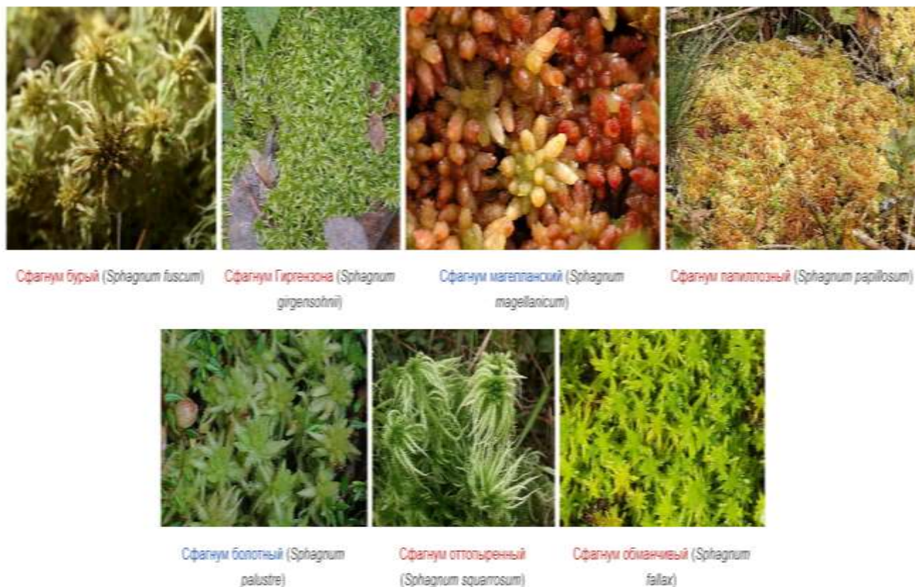
Рисунок 3. -Подкласс сфагновые, белые, или торфяные мхи

Сфагновые мхи демонстрируют высочайшую степень специализации гаметофита, обеспечивающую поглощение воды как из почвы, так и из атмосферы, быстрое ее передвижение по всему телу гаметофита и прочное удержание воды растением. Однако принцип поглощения воды растением основан исключительно на физических законах - капиллярности, гигроскопичности, набухании, т.е. так же, как у юнгерманниевых, имеет место тонкая специализация на базе низкого эволюционного уровня.