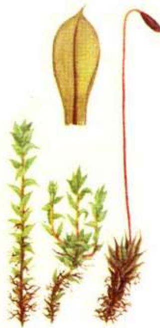
Рисунок 4. - Подкласс андреевые мхи (andreaeidae)

Подкласс зеленые мхи (Bryidae). К числу особенностей этого подкласса относятся: