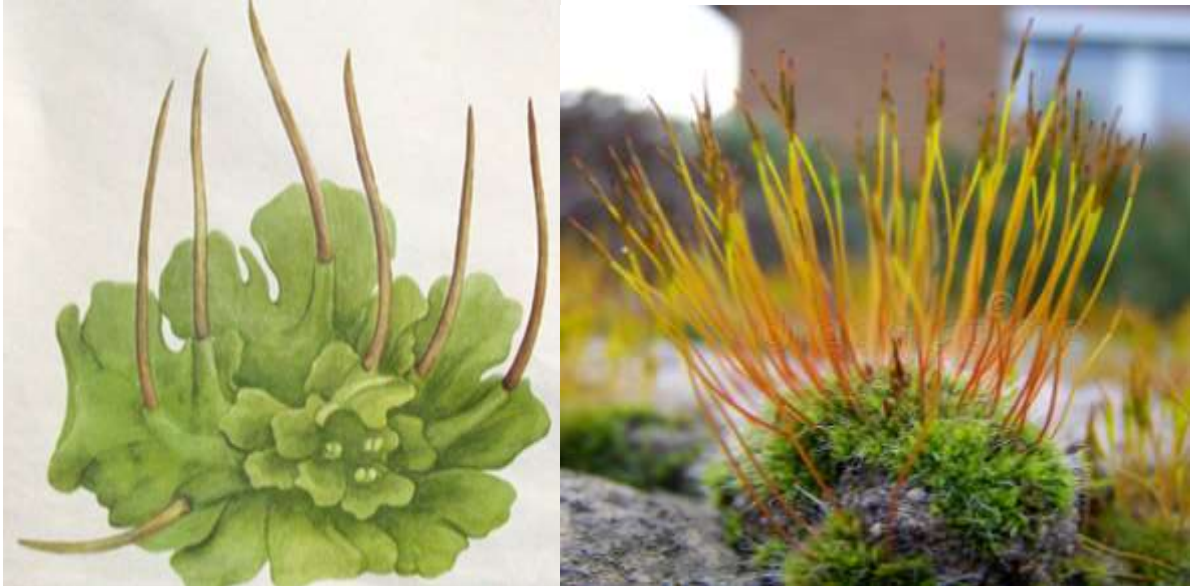
Рисунок 2. -Антоцеротовые мхи (Anthocerotopsida)

основании ее близ меристемы находятся споры незрелые и только что возникшие. В центре коробочки проходит узкая колонка, которая также все время подрастает снизу. Стенка коробочки сверху покрыта эпидермой с типичными устьицами, а под эпидермой располагается фотосинтезирующая ткань. Особенность гаустории заключается в том, что иногда она прорастает сквозь пластинку гаметофита и внедряется в почву, развивая на своей поверхности ризоиды. Все это подтверждает взгляды о том, что когда-то спорофит вел самостоятельный образ жизни и имел более сложное строение.